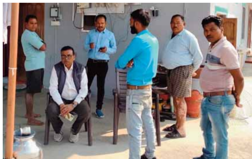
हरिभूमि न्यूज अनूपपुर।

बिजली की लगातार चोरी पर विद्युत विभाग फिर संगीन दिखाई पड़ रहा है। गांव गांव, शहर शहर सघन चेकिंग करते हुये बिजली चोरी करने वालों पर जुर्माना लगाया जा रहा है। अधीक्षक अभियंता (संचारण/संधारण) मध्य प्रदेश पूर्व क्षेत्र विद्युत वितरण कंपनी लिमिटेड अनूपपुर ने नवम्बर माह के शुरूआती दौर में बैठक बुलाकर जिले के सभी ग्रामीण और शहरी कनिष्ठ अभियंताओं की टीम निर्धारित करते हुये बिजली चोरी पर सघन जांच के निर्देश दिये हैं। अधीक्षक अभियंता के निर्देशों और कार्यपालन अभियंता के मार्गदर्शन में अनूपपुर ग्रामीण वितरण केन्द्र में 14 नवम्बर 2025 को बिजली चोरी के विरुद्ध सघन जांच अभियान चलाया गया, इस दौरान बिजली की चोरी करने वालों पर जुर्माना कार्यवाही की गई।